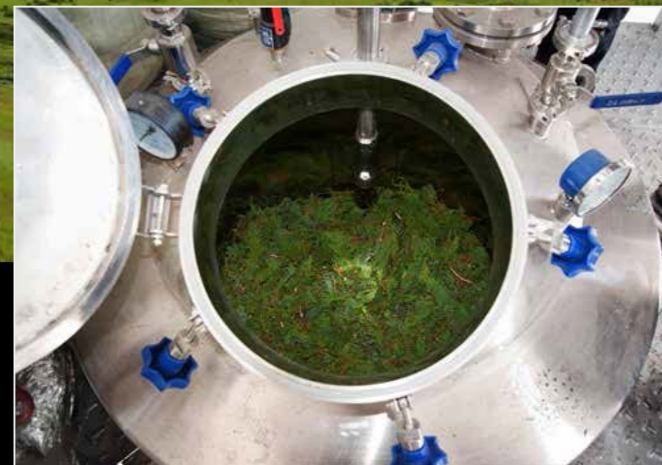
La destilación de la Sabina Squamata

El aceite esencial escogido para esta primera prueba es de la Sabina Squamata, una variedad de enebro denominada Spama y utilizada por los tibetanos para elaborar su incienso tradicional.