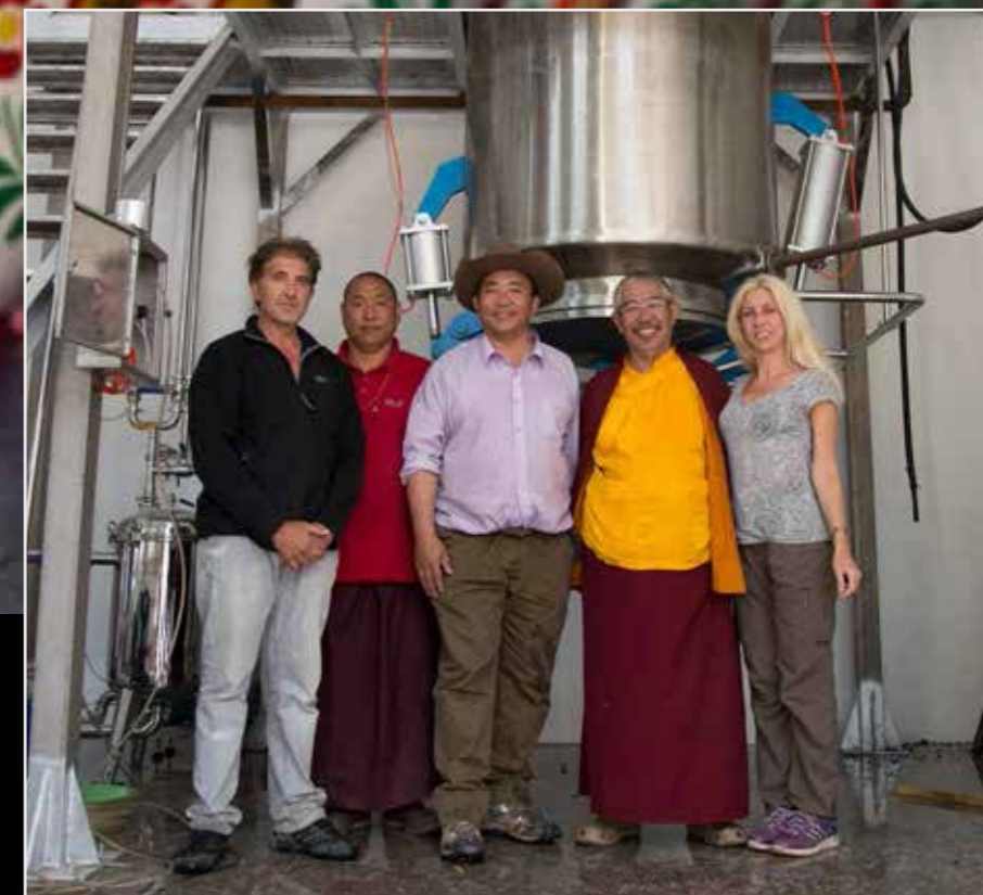
El equipo del laboratorio HÉVÉA con los fundadores del ambulatorio de Dzongsar

Esta experiencia ha sido muy provechosa, tanto en el aspecto humano como en relación con el conocimiento que nos ha permitido adquirir. Gracias a ella, hemos podido consolidar este proyecto y darle el impulso necesario para que pueda proseguir de forma ética y sostenible .